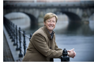
Andreas Carlgren Miljöminister

"Sverige är inte störst - men vara först. Vi har engagerad befolkning och näringsliv som vill ligga i frontlinjen. Avgörande är framväxandet runt om i landet av ny företagsamhet, som bygger på ny teknik och nya lösningar. Erfarenheter och exempel, som här i Dalarna, som vi kan visa upp för omvärlden."